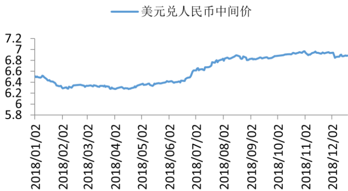
美元兑人民币中间价