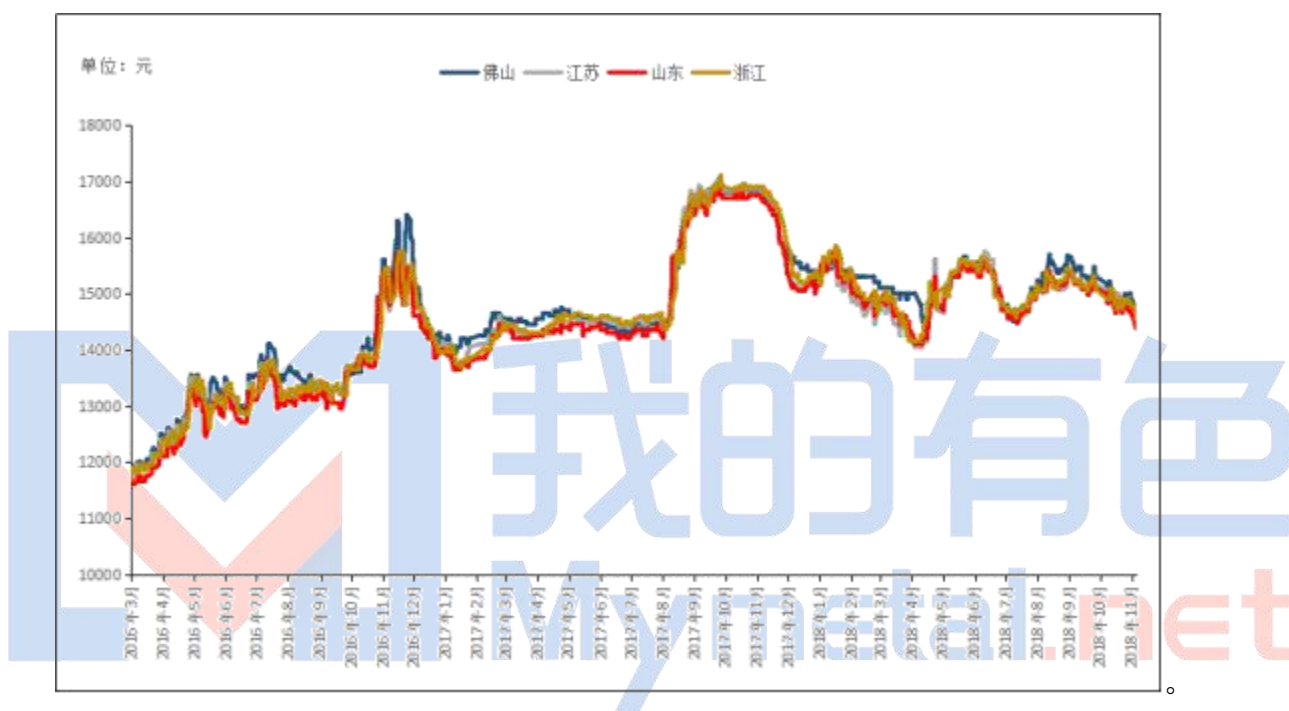
图4 全国主流地区 A356.2 铝合金锭价格走势 规格：国标

本周原铝长江周均价 13724 元/吨，较上周下跌 224 元。原铝南储周均价 13778 元/吨，较上周下跌 260 元。原铝系合金锭本周加工费维持稳定，较上周持平，本周出货价格主要随原铝价格波动。其中，各地区 A356.2 合金锭价格情况：目前江浙沪地区 A356.2 均价为 14400 元/吨，广东地区均价为 14575 元/吨，山东地区均价为 14270 元/吨，内蒙古地区均价 14480 元/吨。云南地区均价为 14370 元/吨。