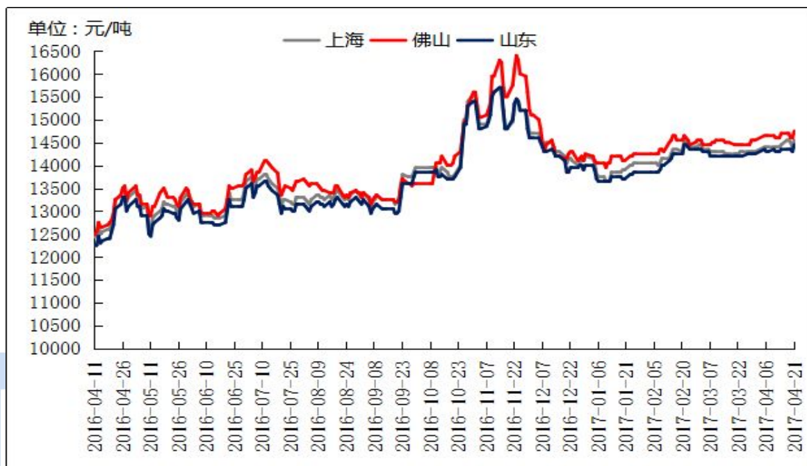
图四 全国主流地区 A356.2 铝合金锭价格走势 规格：国标