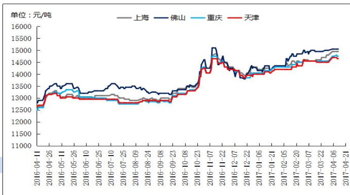
图三 全国主流地区 ADC12铝合金锭价格走势 规格：国标