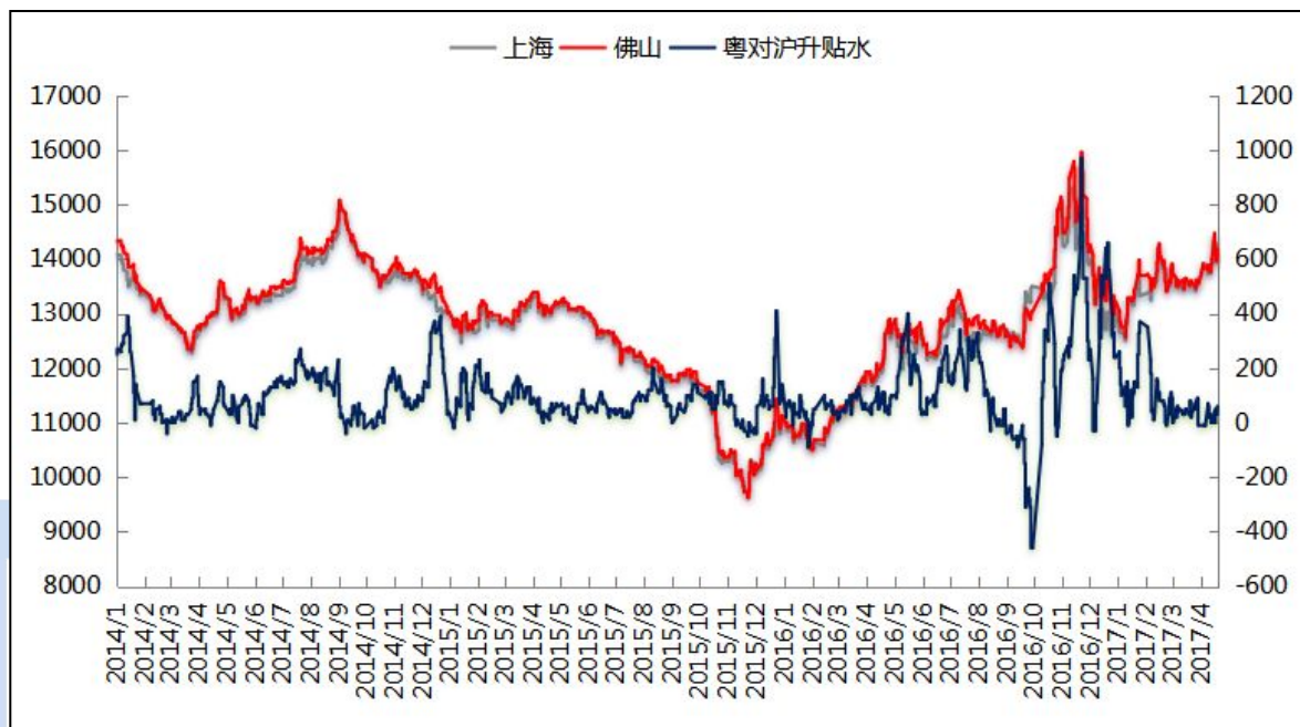
图一 沪粤两地现货铝锭价格走势对比图