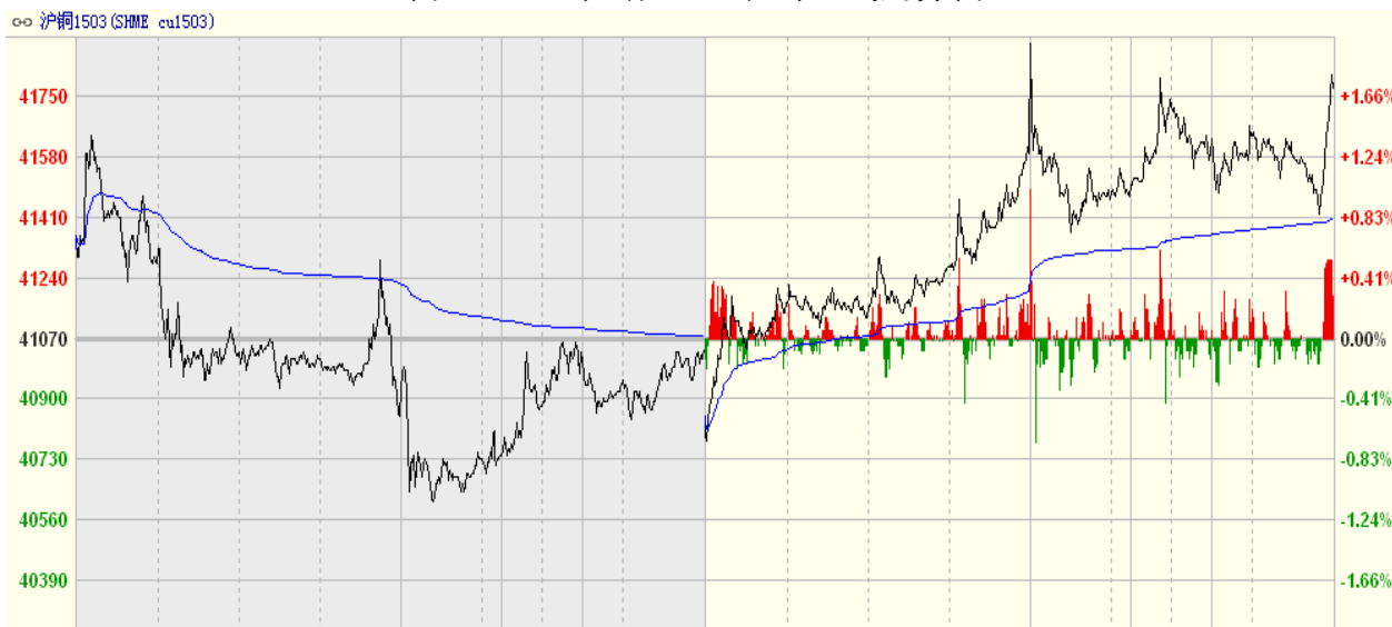
图一 19日沪铜1503合约K线走势图