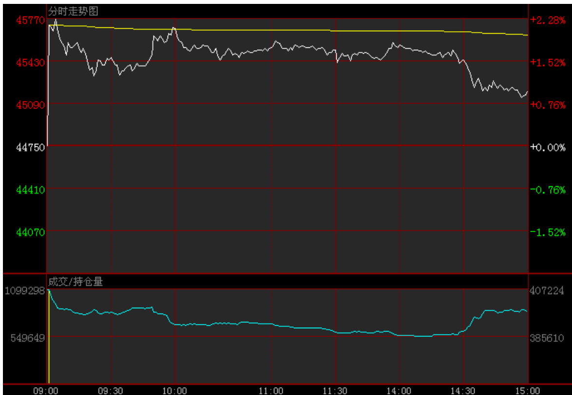
图 5：3 月 20 日沪铜 1406 合约分时走势图

本报告由上海钢联有色事业部开发，版权属于上海钢联电子商务股份有限公司，未经授权不得复制、转发，引用需备注来源。