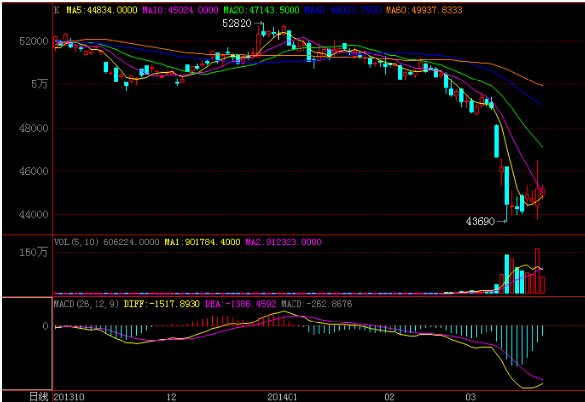
图 6：3 月 20 日沪铜 1406 主力合约日线图