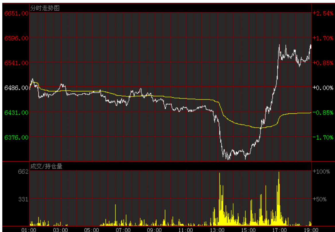
图 9：伦铜电三 3 月 19 日分时走势图

本报告由上海钢联有色事业部开发，版权属于上海钢联电子商务股份有限公司，未经授权不得复制、转发，引用需备注来源。