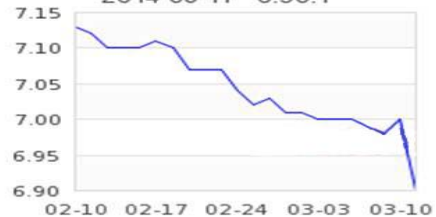
沪伦比值 (SHFE/LME) 30天走势图 2014-03-11 6.90:1