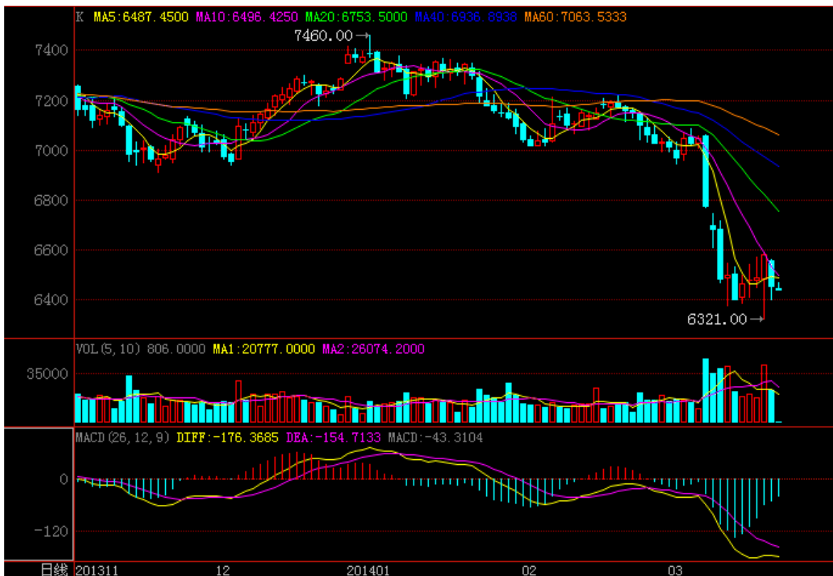
图 8：3 月 19 日伦铜电三日线图