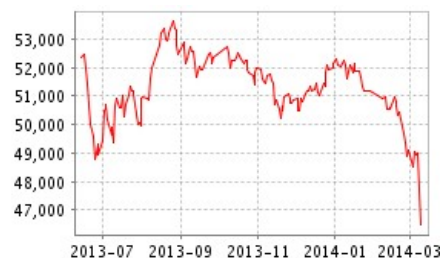
电解铜价格走势图

换月后，铜市空头持续，市场悲观情绪依然浓厚，连续大幅下跌之后，铜市需自我调整；我的有色网认为当前趋势下铜市或出现小幅反弹趋势，逢高可做空。