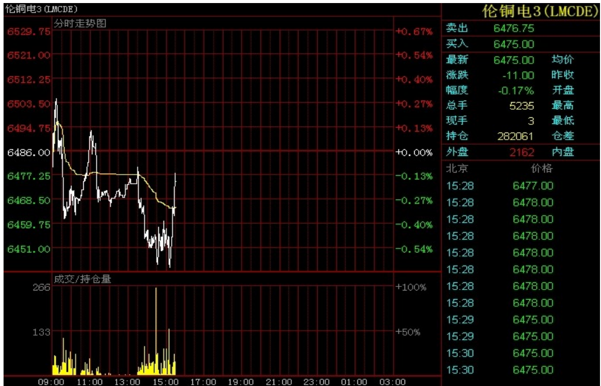
图 9：伦铜电三 3 月 19 日分时走势图

本报告由上海钢联有色事业部开发，版权属于上海钢联电子商务股份有限公司，未经授权不得复制、转发，引用需备注来源。