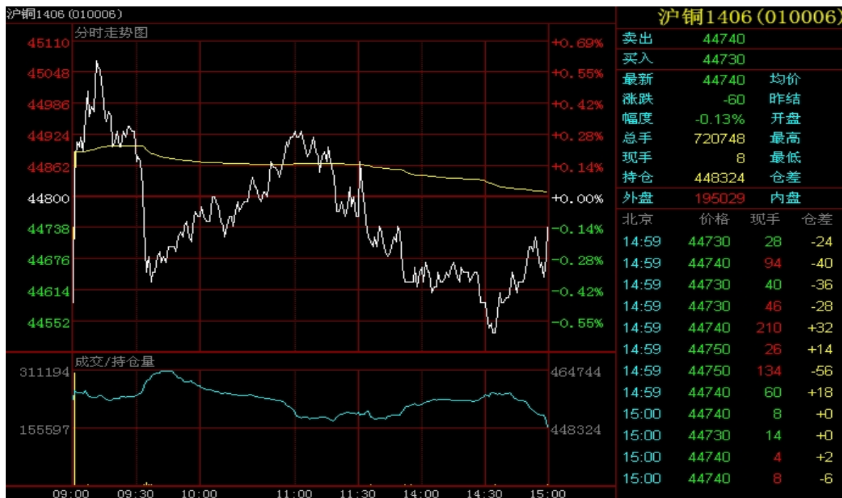
图 5：3 月 19 日沪铜 1406 合约分时走势图