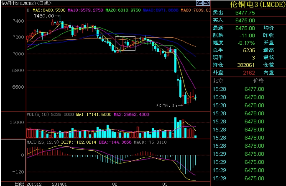
图 8：3 月 19 日伦铜电三日线图

伦铜走势显得胶着，反复于 6500 美元/吨一线，下方 6200 美元/吨提供支撑，市场关注美联储政策会议。