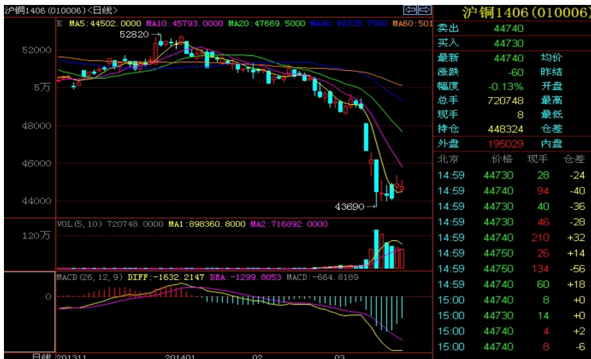
图 6：3 月 19 日沪铜 1406 主力合约日线图

本报告由上海钢联有色事业部开发，版权属于上海钢联电子商务股份有限公司，未经授权不得复制、转发，引用需备注来源。