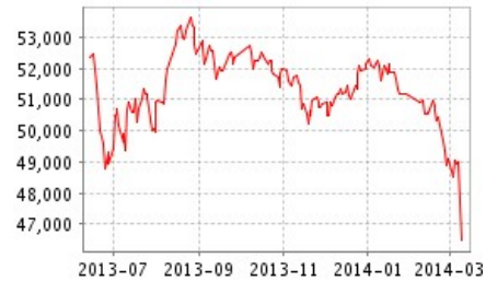
电解铜价格走势图

季末逼近，目前来看，铜市空头趋势仍未改变，此类大跌动作或仍可在短期内发生，尽管历史上铜价的暴跌可能有反抽，但我的有色网认为当前趋势下铜市相对较为疲弱，反弹希望不大。