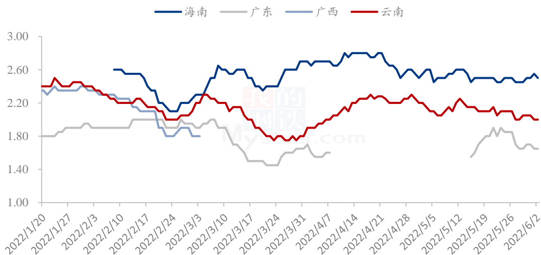
香蕉主产区好货平均价格（元/斤）