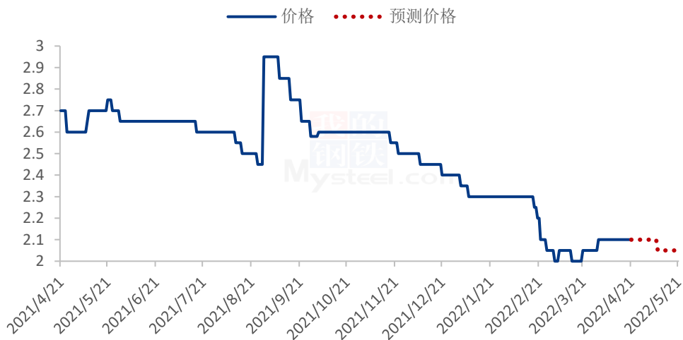
(2021-2022年) 赤峰张杂13号谷子价格走势 (元/斤)

春播将近，新季谷子种植面积成为影响谷子价格波动的重要原因，预计全国新季谷子种植面积将减少 3 成左右。近期谷子价格以稳为主，根据往年购销情况看，五一前后市场有适当补货需求，或将小幅利好谷价。另物流影响仍存，物流条件改善前价格或以坚挺为主。