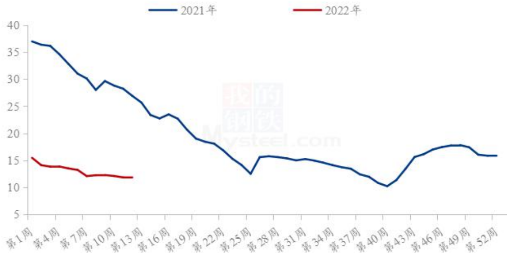
全国外三元生猪出栏均价走势图（元/公斤）