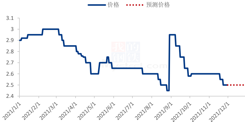
2021年赤峰黄金苗谷子价格走势（元/斤）

注：9月初赤峰新谷陆续上市，市场交易以新谷为主，因此9月开始价格主要为新谷价格。