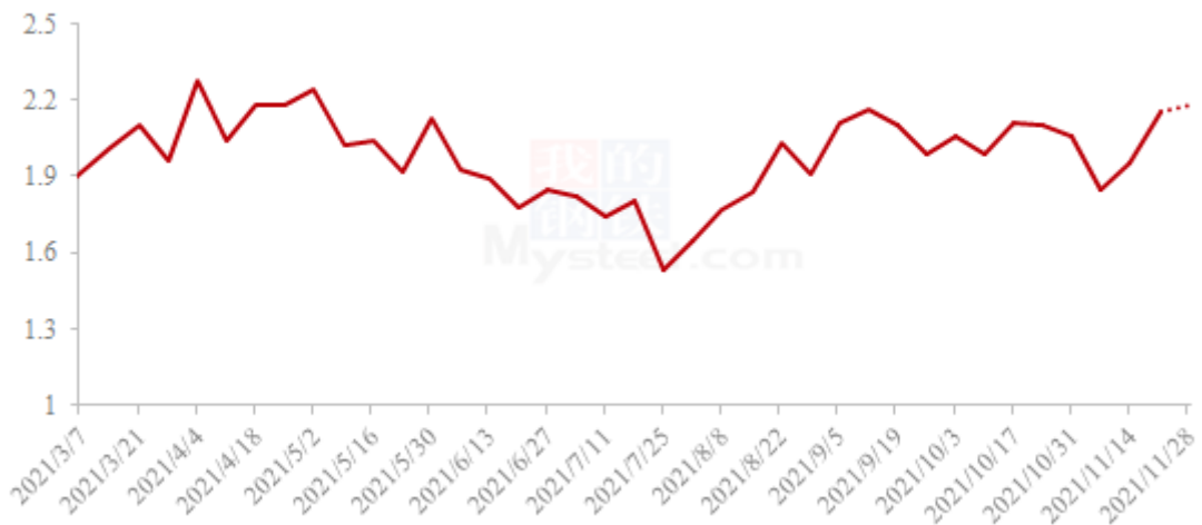
2021年我国香蕉批发市场周度交易量（单位：万吨）

本周重点批发市场香蕉日均交易量约为 3126 吨，环比上周增加约 1.92%，各市场走货情况不一。本周市场价格波动不大，应季水果供应量减少，市场备货积极，产区好货货源仍偏紧，价格高位运行，批发商根据成本及走货情况适当调整价格，市场整体走货量稍有增加，短线内暂无明显持续性利好提振。