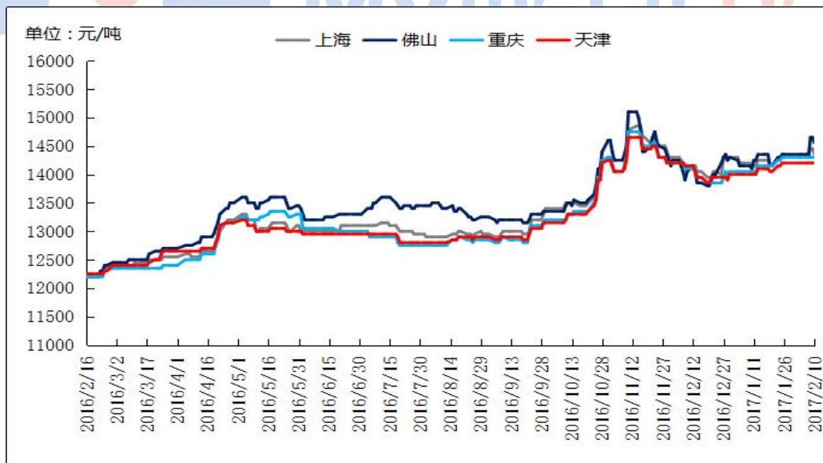
图三 全国主流地区ADC12铝合金锭价格走势 规格：国标

具体价格方面，截止目前佛山地区再生系合金ADC12主流现金成交价为14400-14700元/吨区间，均价14550元/吨。上海地区ADC12主流现金成交区间为14200-14500元/吨，均价14350元/吨，环保型产品含账期（一般30天以上）成交价多在14500元/吨左右，而中小企业现款成交价仍多在14150-14350元/吨区间（多为外地货源）。华北地区ADC12交易价格区间维持在14000-14300元/吨。西南地区成交价则在14100-14400元/吨区间，市场竞争激烈，冶炼厂报价较为混乱，小型加工厂出货意愿强，报价较低，大型加工厂报价较高。