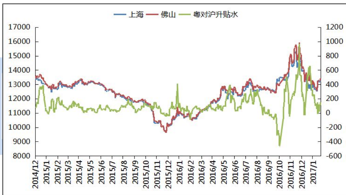
图一 沪粤两地现货铝锭价格走势对比图

现抛期积极，成交基本在贸易商之间，市场整体表现活跃。临近周末，期现价差缩小，贸易商出货积极，市场流通货源充足，整体成交一般。华东地区下游企业基本完全返工，但维持观望心态较浓。华南地区下游还未完全开工，消费偏弱，成交偏淡。