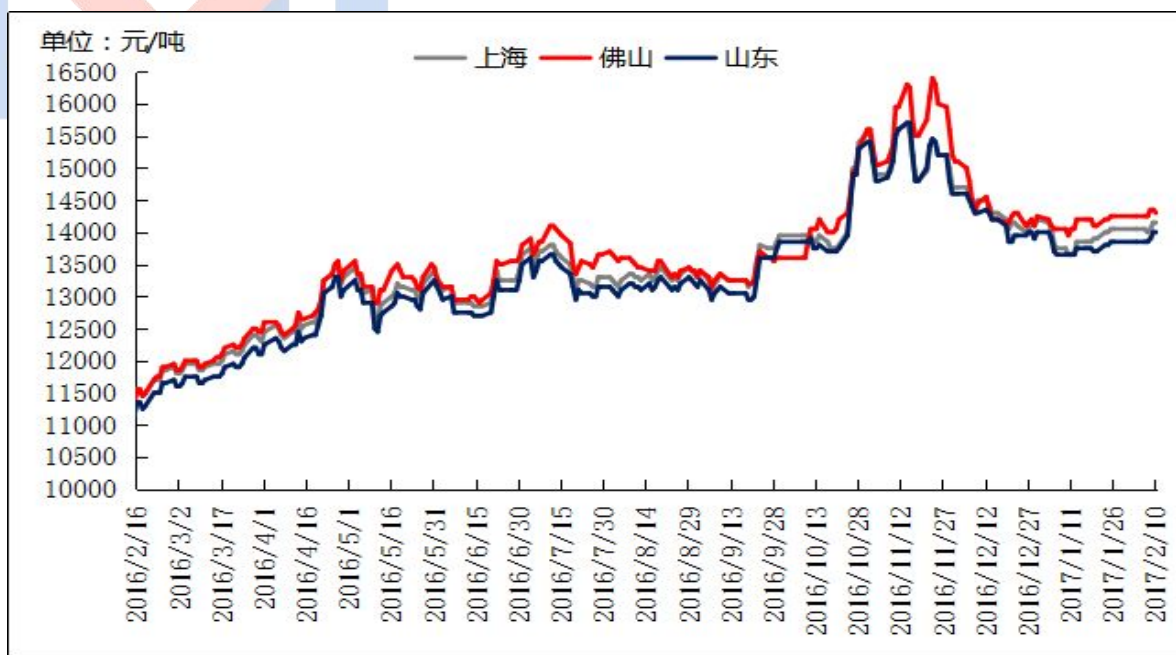
图四 全国主流地区 A356.2 铝合金锭价格走势图 规格：国标

原铝系铸造铝合金锭方面，本周价格稳中小涨。其中，佛山地区 A356.2 成交价为 14200-14400 元/吨，均价 14300 元/吨，货源仍以云铝、沾益锆晟、百色百矿等品牌为主。上海、江苏等主流消费地区 A356.2 成交价为 14050-14250 元/吨，均价 14150 元/吨，货源以创新、云铝、青铜峡铝、方略、创丰、包铝等品牌为主。据我的有色网调研，山东创新、云铝、百色百矿、方略等大型冶炼厂春节仍保持至少一条线生产，2月6日 80%企业都已开工恢复正常生产及销售，但下游加工企业节后开工率较低，接货意愿不强，成交清淡，受长江价格上调影响，A356.2 等原铝系合金锭价格维持高位。