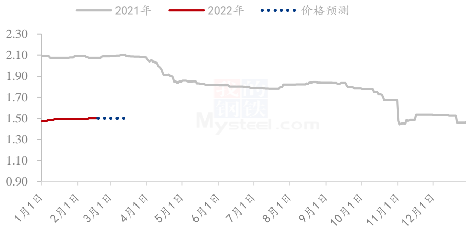
2022年高粱价格预测走势图（元/斤）

产区高粱供应相对宽松，下游需求整体偏弱，目前产区贸易商建库存对高粱短暂拉动，后期还需关注贸易商建库存情况。预计短期高粱的价格平稳运行。