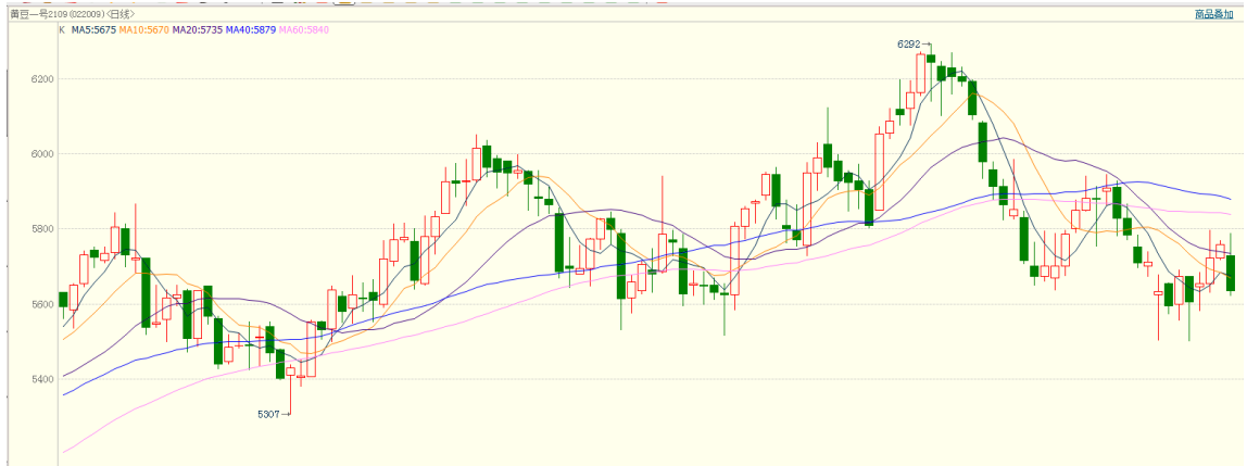
图 2 国内连豆一期货走势图